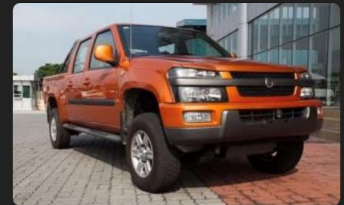
Plutus — среднеразмерный пикап

Годы выпуска: 2007–2012 гг. Автомобиль выпускался с колёсной формулой 4X4