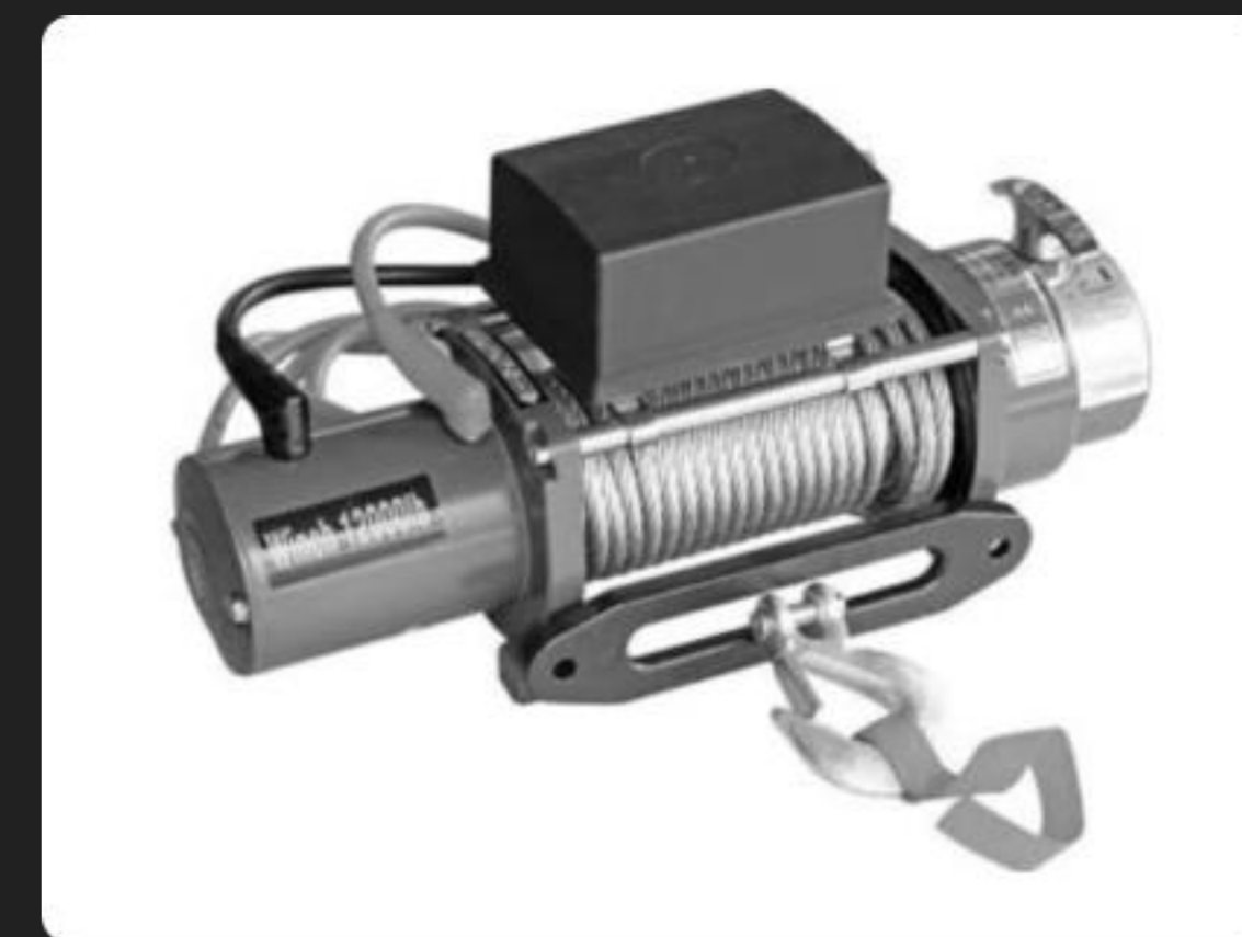
Платформа крепления лебедки спереди (внесен в ОТТС)