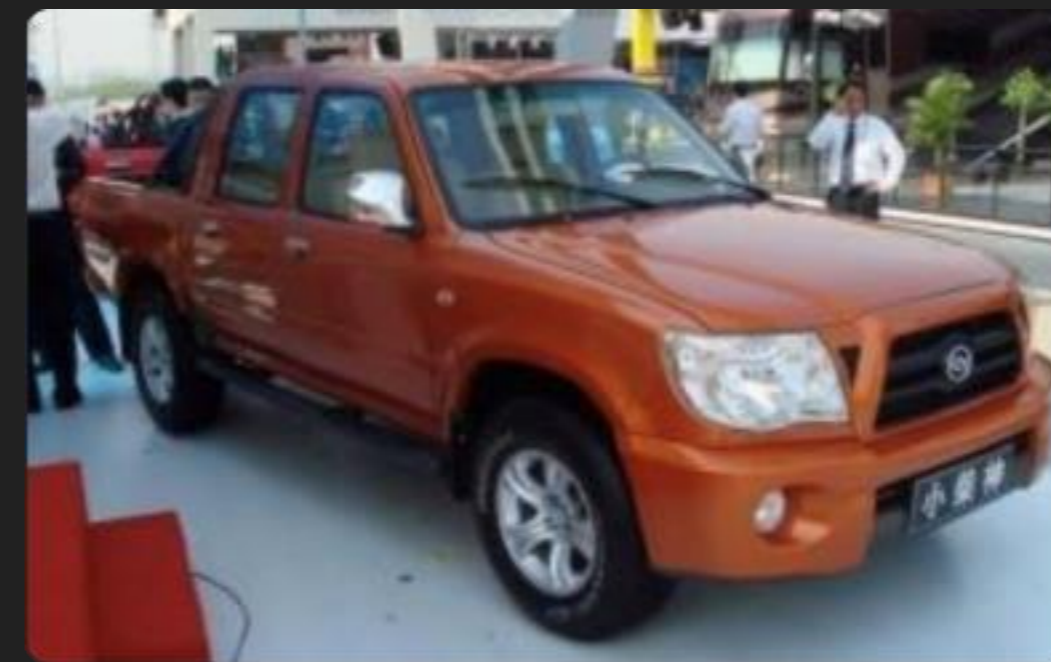
Steed — среднеразмерный пикап

Годы выпуска: 2007–2012 гг. Автомобиль выпускался с колёсной формулой 4X2