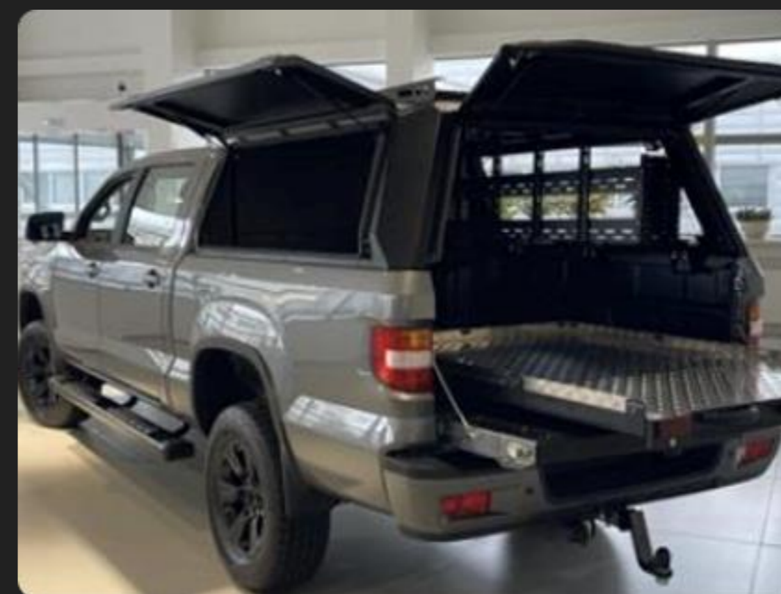
КУНГ металлический (внесен в ОТТС)