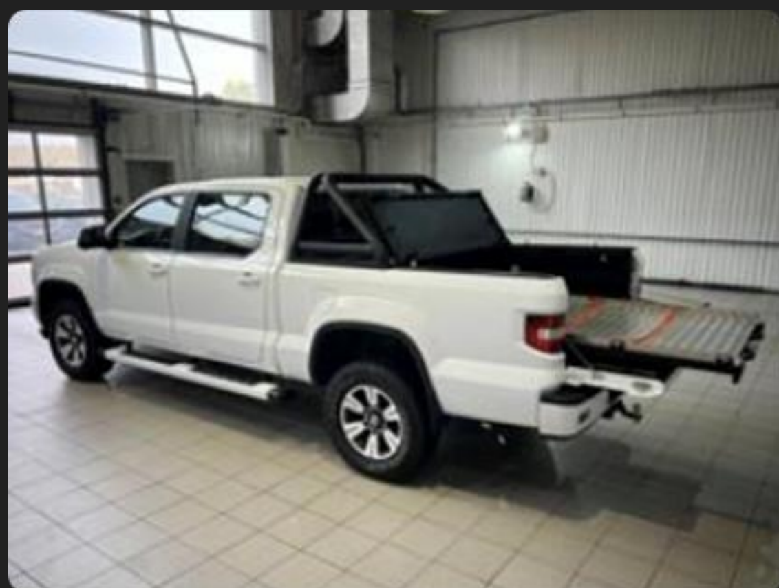
Фаркоп (ТСУ внесен в ОТТС)