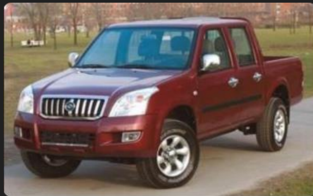
Antelope — среднеразмерный пикап

Годы выпуска: 2006–2009 гг. Ходовая часть от модели Mitsubishi L200 второго поколения (1997 г.)