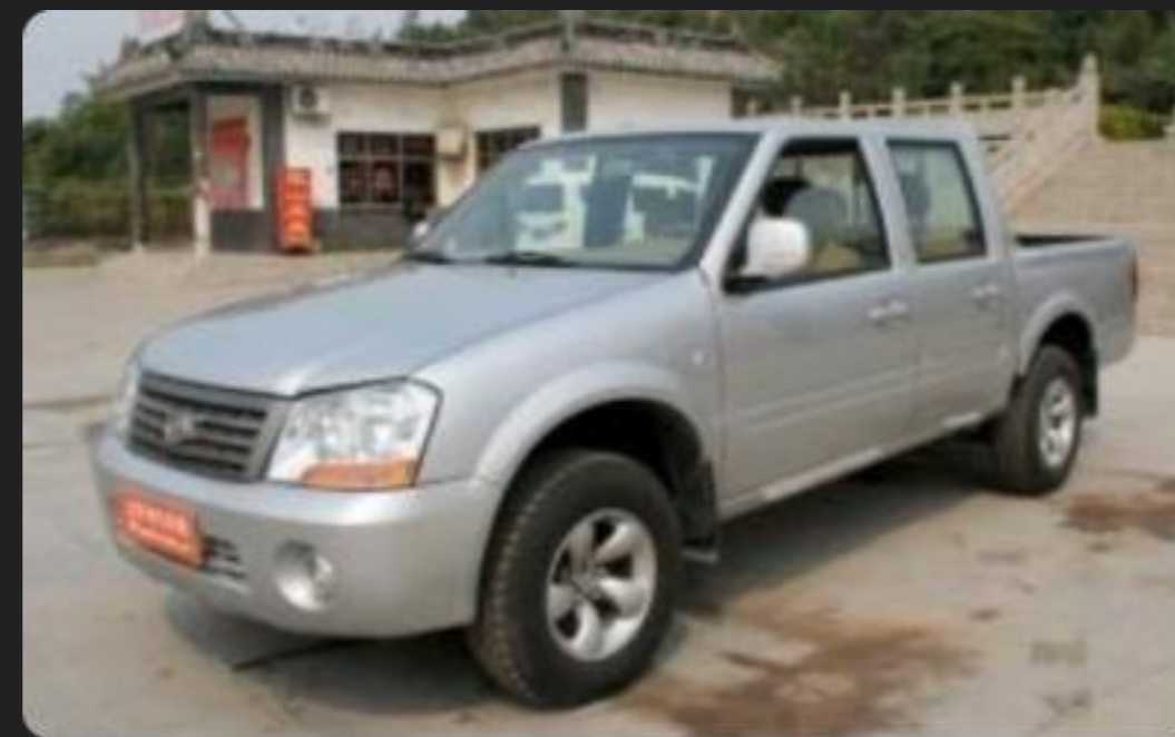
Steed — среднеразмерный пикап

Годы выпуска: 2006–2009 гг. Ходовая часть от модели Mitsubishi L200 второго поколения (1997 г.)